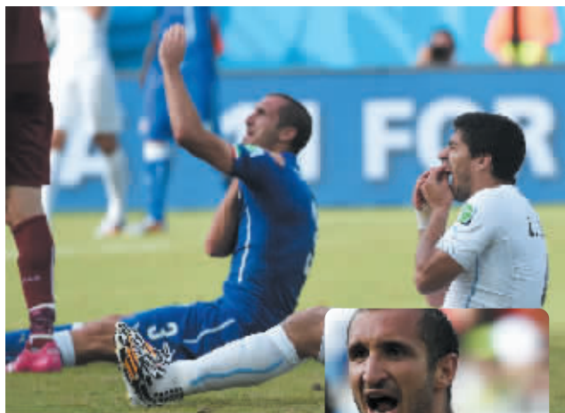
际足联表示要对这次“咬人”事件做出调查,苏亚雷斯对此并不担心。他说:“我已经听说了(要调查我),如果他们要调查,他们就该待在球场上,那是比赛中发生的正常事件。”(据新华网)