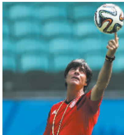
◀ 德国教练尤希姆·勒夫在训练场上。