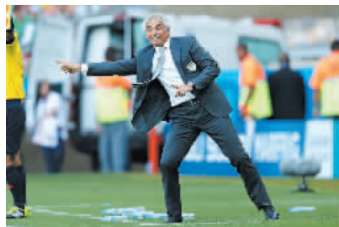
▶ 阿尔及利亚教练亨利·勒霍季奇在对战比利时的赛场上。

2014 年巴西世界杯已经过了将近一半,在那一场场或平淡或离奇或惊险或刺激的比赛背后,32 强的教练无不竭尽所能地导演了一段段悲喜交错的剧情,其中有的轰轰烈烈,有的沉闷乏味,有的让人扼腕,有的让人切齿,然而教练的“形体艺术”正是世界杯的魅力之一。