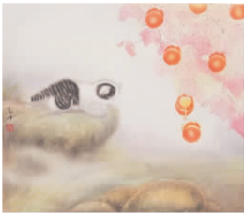
米春茂 猫趣图 简介:中国美协会员,一级美术师,河北沧州画院院长。