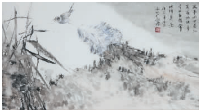
林斌 花鸟 简介:广东惠州著名画家,中国美协会员,一级美术师。