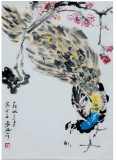
袁晓岑 春城三月 简介:曾任中国美协理事,云南美协主席。

中国书画艺术是中华传统文化的精髓所在,它书写了中华儿女博大、坚毅、浩气式的民族精神,融合了自古以来中国文人对于自然、社会及其与之相关的政治、哲学、宗教、道德、文艺等各方面的认识。如此丰富灿烂的文化性与艺术性使得中国书画长久以来占据了艺术品收藏市场的半壁江山,无论古时与今日,无论王侯将相亦或商贾贵胄,莫不为了得到一幅名家真迹而备感殊荣。