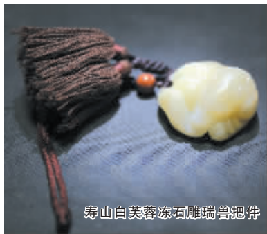
寿山白芙蓉冻石雕瑞兽把件