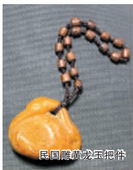
民国雕黄龙玉把件