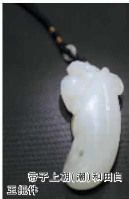
带子上朝(潮)和田玉玉把件

传世的杂件收藏品，只能说杂，不能说多。假如我们手上有100万元现金，我们可以在几天之内从古玩市场收进百件、千件历代高古陶瓷、明清民窑彩瓷精品。但要想在几天之内收进百件、千件上品的明清竹雕、牙雕、木雕、铜雕、角雕，或鼻烟壶等杂件，几乎没有可能。说杂件收藏如聚宝盆，特指杂件收藏品杂中有精华，杂中有珍宝，长年累月，积累多了，收藏家自然成了聚宝人。