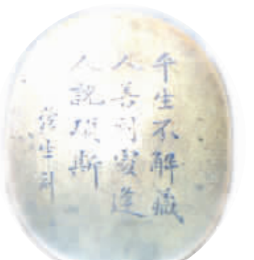
清同治陈寅生墨盒，曾用于科举考试。