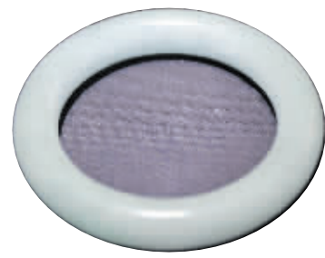
缅甸老坑糯种翡翠镯

杂件谓之杂，其藏品杂，价格也杂。除竹雕、犀牛角、牙雕、端砚、鼻烟壶等有可比较的拍卖行情外，其他更稀、更奇的杂件如鸟笼、手炉、果核雕、铜墨盒、嵌银铜器、古墨等，还没有历年系统的拍卖行情可参照，主要凭收藏家个人的眼力、经验来判断其收藏价格。“杂件，古玩界人人都懂；杂项，古玩界多不精通”，这是历年来杂件收藏的状况。故有心收藏杂件者，其收藏投资增值潜力、投资增值倍率应该远远高于陶瓷、书画、明清家具。因为，陶瓷、书画等价格已相对到位，而杂件工艺品却很少有人真正识其珍贵及工艺价值，故拍卖市场还没有形成合理系统的价格参照系。古玩市场上，如今以数百数千元买进价值数万元以上的出自名家之手的竹刻、内画鼻烟壶、铜墨盒、手炉、印章的故事，几乎天天在发生。