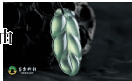
是最具有保值、升值和传承文化特点的收藏种类。

市场的盛行：在我国投资渠道仍不够顺畅的今天，越来越多的投资者已从股票、房地产等传统投资逐渐向收藏投资倾斜。而所有收藏范畴中，宝玉石又