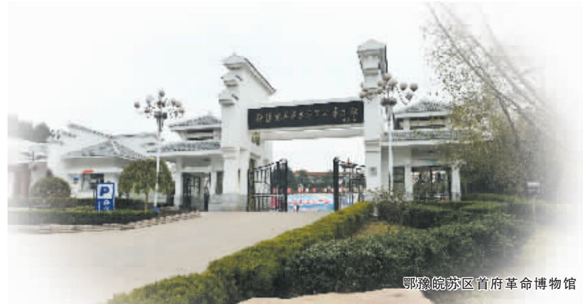
鄂豫皖苏区首府革命博物馆