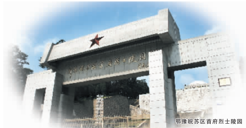
鄂豫皖苏区首府烈士陵园