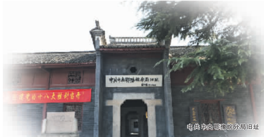
电报中央鄂豫皖分局旧址