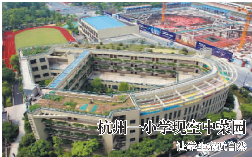
杭州一小学现空中菜园 让学生亲近自然

5 月 15 日,记者在杭州火车东站附近一楼顶拍照时,发现脚下一所小学楼顶种植了许多蔬菜,菜地里有西红柿、刀豆、土豆、黄瓜等数十种蔬菜。