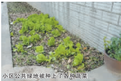
小区公共绿地被种上了各种蔬菜

记者感言: 小区公共绿地是属于所有业主的公共空间,私自在公共绿地上种菜显然是侵犯了其他业主的权利,同时也破坏了小区的整体绿化。部分市民把公共用地变为“私家菜园”,就等于把公共用地占为己有,这样的种菜娱乐了自己,却害苦了他人。而且这种行为是不遵守城市管理的相关规定和公共道德的,是无视公共绿地属于小区业主共同所有,同时也是一种极不文明的行为。创建国家卫生城市不是哪一个人的事情,它需要所有市民集体参与共建。为了我们的城市能够更加美丽,请从身边的小事做起。