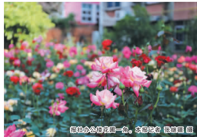
报社办公楼花园一角。

重健康。5日立夏,气温明显升高,这还真不错,据中国气象网预报,明日,我市最高气温将达到30°C,真真切切地“奔三”了。这说明,火辣辣的夏天已经敞开大门,正等着我们呢。