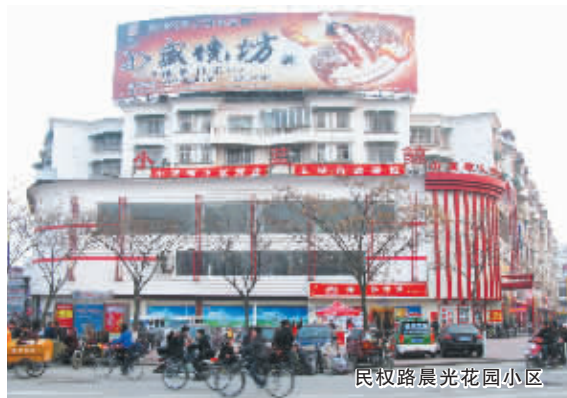
民权路晨光花园小区