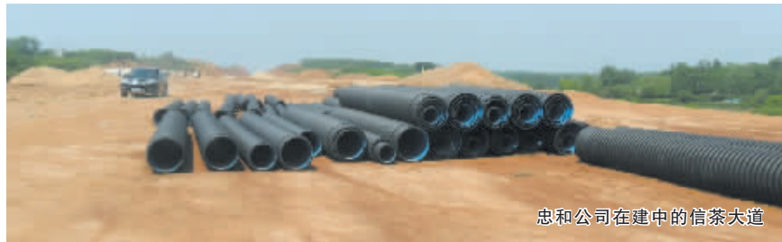
忠和公司在建中的信茶大道