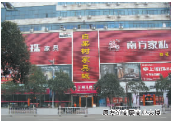
原友谊商厦商业大楼