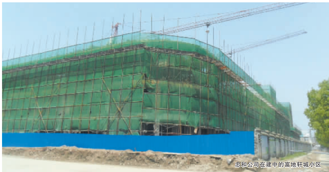
忠和公司在建中的富地轩城小区