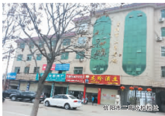
信阳市二高分校校址