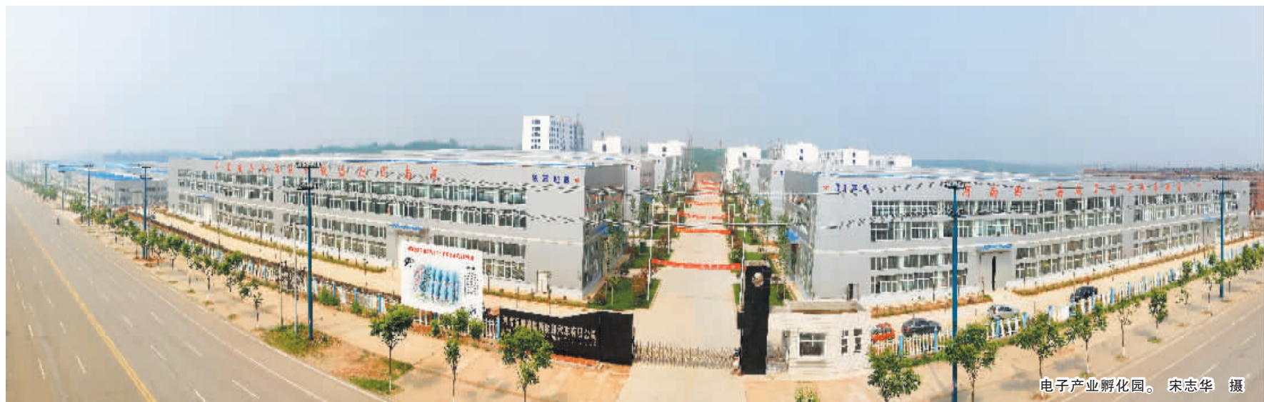
电子产业孵化园。

今后，信阳市产业集聚区将继续学习工业，理顺发展思路；研究工业，把握发展规律；支持工业，提高发展本领，以创建国家级高新区为核心，加快现代产业化和新型城市化建设，努力把集聚区打造成中原经济区重要的电子产品研发生产中心和魅力信阳未来的宜工、宜商、宜居、宜业之所。