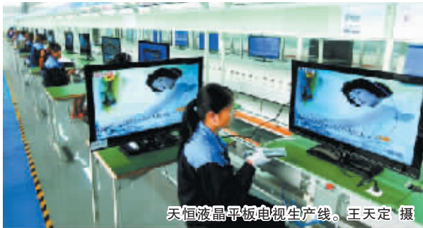
天恒液晶平板电视生产线。