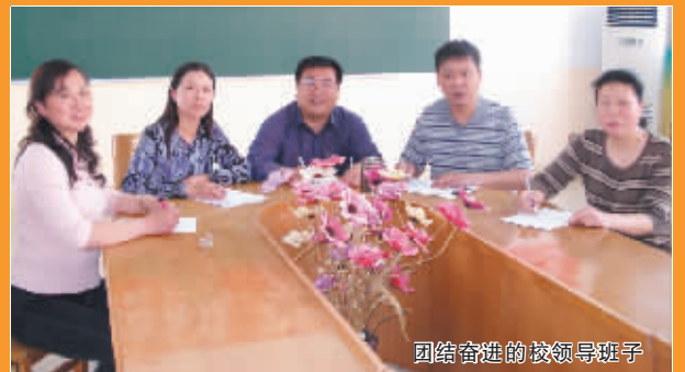
团结奋进的校领导班子

课程改革经验交流会上交流。另外，学校承担了省“十一五”重点课题《多元智能开发与培养的教学策略研究》和省级立项课题《小学思品教学中人文性与思想性和谐发展的策略研究》均已顺利结题，还获得了省级一等奖。