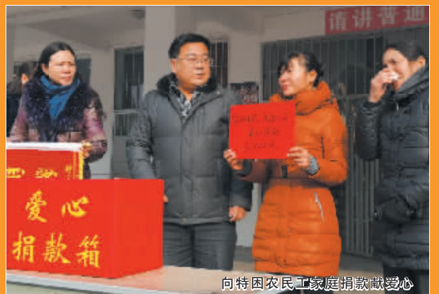
向特困农民工家庭捐款献爱心

周五下午全面开展。2007年以来，该校教师在国家和省级报刊上发表教学论文40余篇，有80多人获国家、省、市优秀教学论文一、二等奖；有30余人获省、市各学科优质课一、二等奖；有15名教师成为了省特级教师、省级学术带头人、省级骨干教师、省“五一”劳动奖章获得者。