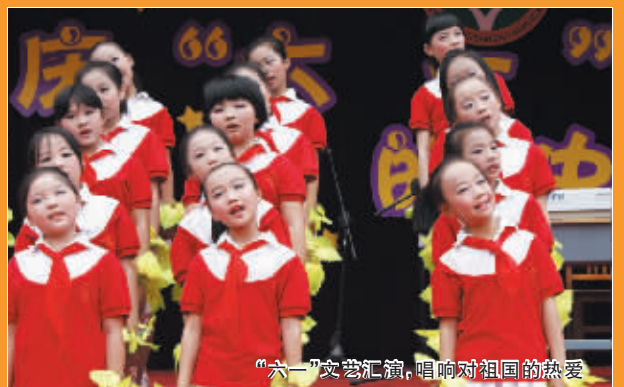
“六一”文艺汇演，唱响对祖国的热爱

2010年，该校参加信阳市庆“六一”文艺汇演，荣获优秀组织奖、特等奖；2010年，在市教育局组织的“我们的节日——诗朗诵”大赛中获一等奖；大型歌舞节目《国家》在2010年参加市纪委组织的“大别山清风进校园”演出获得一等奖，得到了市各级领导的好评。2012年，该校“红领巾合唱团”又在全市中小学合唱比赛中获得第一名。