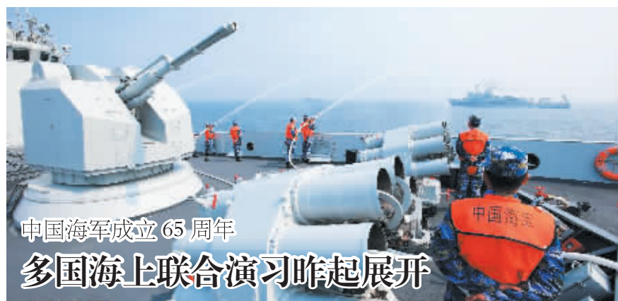
中国海军成立65周年 多国海上联合演习昨起展开

会议要求,各地区、各部门要立足大局,细化措施、狠抓落实,推动建立统一开放、竞争有序、诚信守法、监管有力的现代市场体系,让市场的“发动机”更强劲有力,促进经济社会持续健康发展。(据新华网)