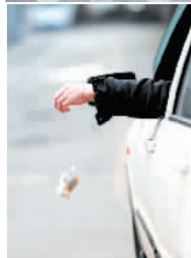
◀马路上的车内乱抛物行为。