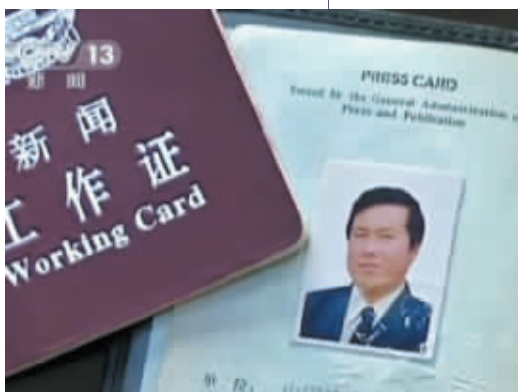
《中国特产报》记者被指存在违规问题。

2013年12月4日,由于内部管理混乱、多名记者涉嫌新闻敲诈,创刊于1994年1月的《中国特产报》(以下简称“特产报”)在即将迎来自己20周年报庆之际,收到了国家新闻出版广电总局的一纸行政处罚决定书,被正式吊销了报纸的出版许可证。