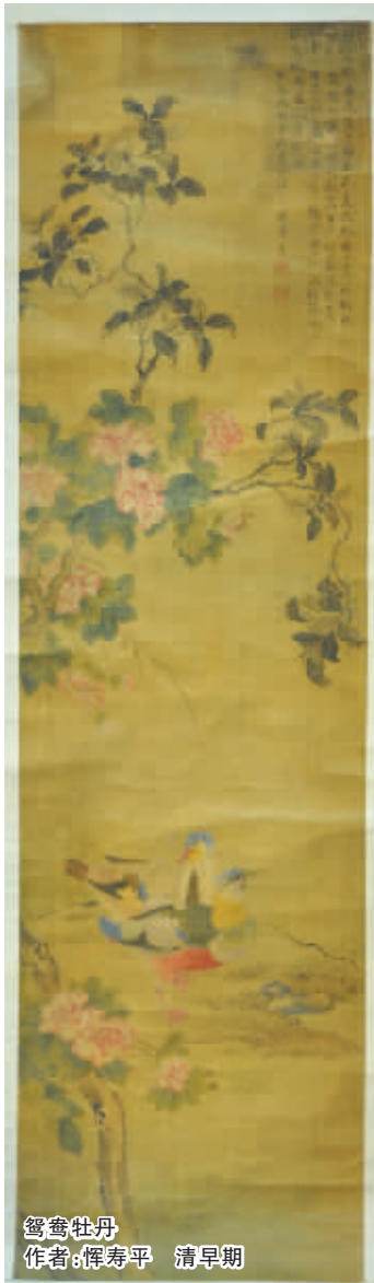
鸳鸯牡丹 作者:恽寿平 清早期