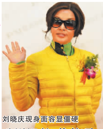
刘晓庆现身面容显僵硬