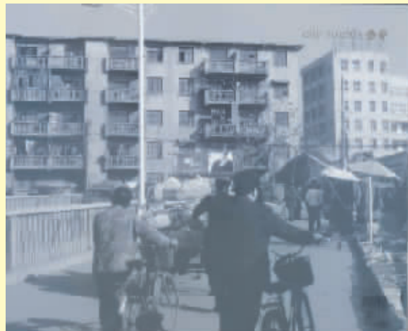
昔日的羊山老街铁路立交桥,摄于1990年。