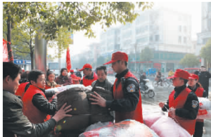
为深化“为何从警、如何做警、为谁用警,永做党的忠诚卫士、百姓的贴心人”大讨论活动,息县公安局于日前开展了“暖冬”募捐冬衣主题志愿服务活动。活动当天,全局民警首捐的1000余件冬衣全部移交给信阳大别山志愿者协会息县分会,以策应他们发起的募捐冬衣爱心活动。

虽然路边不见流动商贩的影子,但是记者发现,农科所菜市场附近的马路边却停放着小汽车、大货车等车辆。这些车辆有些是暂时停放,有些是长期占据,影响交通。 “河南路是市区一条主干道,沿路的商铺很多,车辆停放在路边不仅影响交通,也影响我们做生意,希望有关部门管一管。”李先生说。