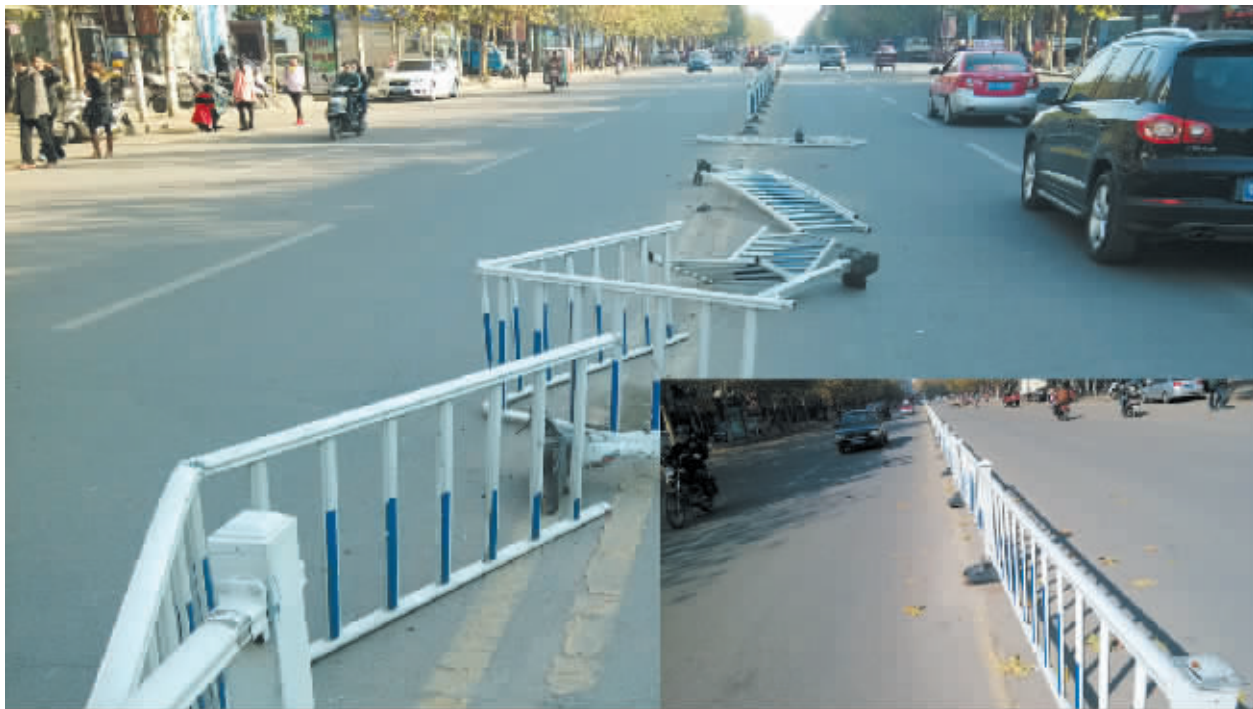
12 月 1 日 14 时 30 分,记者在工区路前进信用社门口发现,马路中央近 20 米长的道路护栏被撞得支离破碎散落在马路上。次日中午 12 时,记者再次赶往该路段,发现被撞坏的防护栏已全部修好。本报在此提醒广大驾驶员,行车时一定要遵守交通规则,做到文明行驶、安全行驶。

12 月 1 日中午,新县沙窝镇古湾村赵洼组正在挖井,但在挖井过程中土石塌方,一人被压在井下。接到报警后,该大队迅速出动一辆抢险照明车和 7 名官兵赶赴现场。该井直径约 1 米、深约 6 米,官兵对井下喊话,隐约还能听到井下男子的声音。根据现场情况,指挥员迅速作出部署:首先将空气呼吸器气瓶打开,用绳索系住将其放到井下,使被困者能够呼吸到空气。然后协调联系挖土机从侧面进行挖掘,慢慢接近被困者,然后再人工挖掘施救。14 时 40 分,挖掘机在土井旁边挖出一个深约 6 米的土坑,大队官兵手拿铁锹下坑施救。随着一点点的挖掘,终于发现了被困者。为了防止再次塌方,官兵给被困者戴上头盔,用手一点点将被困者身上的土石扒开,被困者顺利获救。