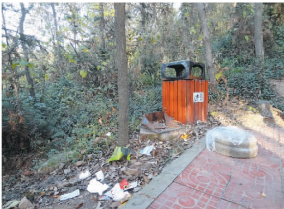
近日,我市持续晴朗天气,很多市民纷纷选择登山、郊游来感受冬日里温暖的阳光。然而,记者在贤山、震雷山等深受市民青睐的山上发现,不少市民随手将垃圾扔在了登山途中,塑料袋、饮料瓶、果皮纸屑等随处可见,大煞风景。图为在震雷山风景区供人休息的小道上被游客扔了许多垃圾,而旁边的垃圾桶里却空无一物。