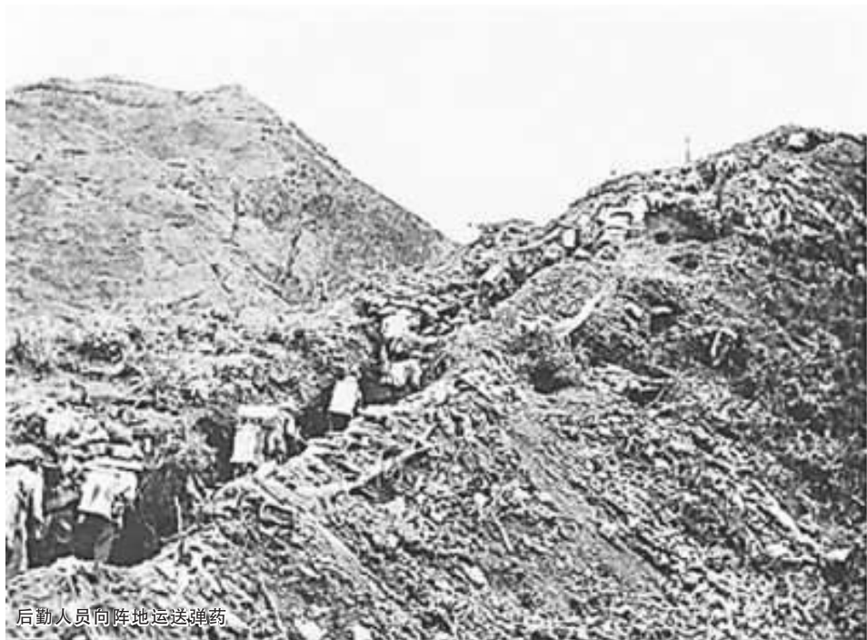
后勤人员向阵地运送弹药