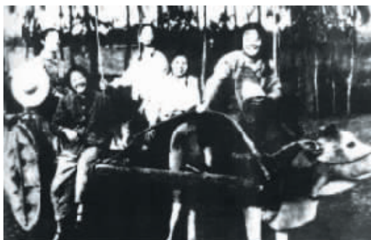
知青坐上自己制作的交通工具——牛车。

1968年,这样的一张张船票为海南送来了6万知青,也送来了千万亩郁郁葱葱的胶林,送来了海南建设发展的新航程。