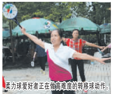
柔力球爱好者正在做高难度的转移球动作。

申泰批发市场的箱包店商家表示,这几日,光顾最多的就是小学生和大学生,箱包的销量也是非常可观,而拉杆成了箱包店里的热门咨询词汇。即将报到的大学生购买拉杆箱,很多小学生则让家长购买拉杆书