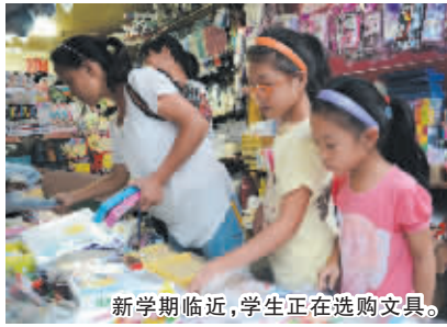
新学期临近,学生正在选购文具。