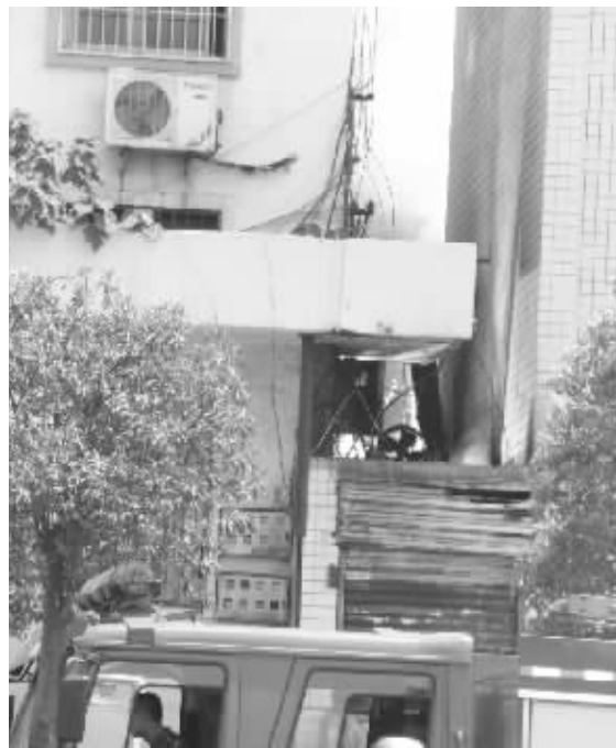
8月9日12时10分,市第一人民医院附近两栋楼中间电线着火,现场蹿起了很高的火苗,幸亏消防官兵及时赶到将火扑灭。据附近居民介绍,着火处有很多电线交织缠绕,而且部分电线老化,这可能是着火的原因。

编者:每年各地的公务员考试,吸引着大批学子前往应试,很多学生毕业后放弃其他工作机会,埋头苦学成为“考公族”。编者有一位朋友奋战在“考公”的路上已有两年,穿梭于全国各地参考,因考试所产生的费用就高达4万元,而至今仍未能如愿。其实,学子们大可以走出家门,去更广阔的空间里实现自己的职业理想,也许几年过后,他们会找到更适合自己的职业,赢得一个属于自己的完美人生。