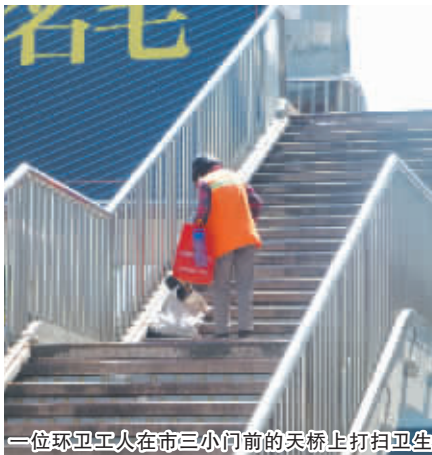
一位环卫工人在市三小门前的天桥上打扫卫生

市政设施固然需要更人性化,但是人心的浮躁也该好好降降温。每天多花点时间遵守社会秩序,看似耗费了时间,其实是实现了效率的最大化。俗话说无规矩不成方圆,只有你我都去维护遵守社会秩序,我们的生活才会更加文明、便捷。