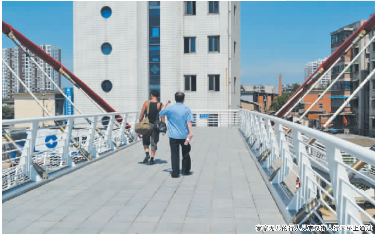
寥寥无几的行人从京汉街人行天桥上通过

近日,有不少市民向本报打来热线称,市区两座人行天桥成了“摆设”,选择过天桥的行人很少,对此本报派出记者,兵分两路,分别前往东方红大道市三小门前和京汉街的两座天桥实地采访。