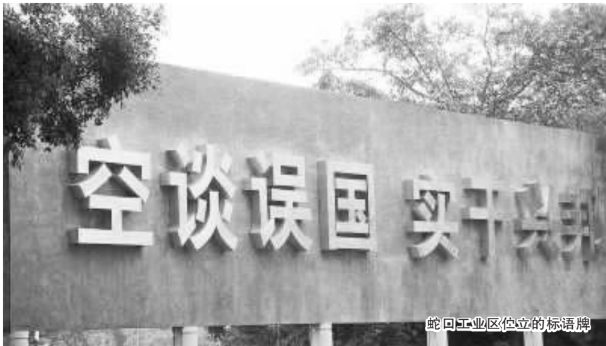
蛇口工业区竖立的标语牌

2013年,“空谈误国,实干兴邦”——这句20年前横空出世的“深圳观念”再一次引发全国上下共鸣和海内外关注。