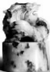
空谈误国 实干兴邦 篆刻 周南海