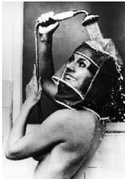
1970年发明的沐浴头套,特别适用于那些喜欢化妆又舍不得洗掉的女人。