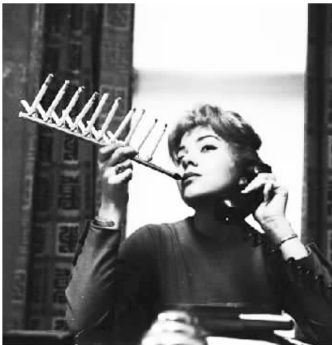
1955年发明的豪华烟斗,用这个烟斗,一次能抽掉一盒烟。