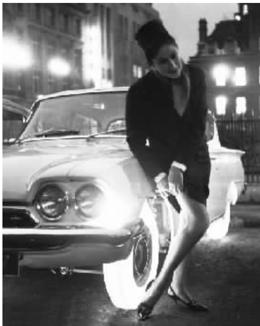
1961年发明的夜光轮胎,用透明合成橡胶做成的轮胎里头通上电灯泡,这样一来,夜色里的女士就可以借着灯光整理自己的丝袜了。