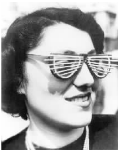
1956年发明的百叶窗太阳镜,在当时,这是个糟糕透了的发明,可是没想到今天成了时尚。