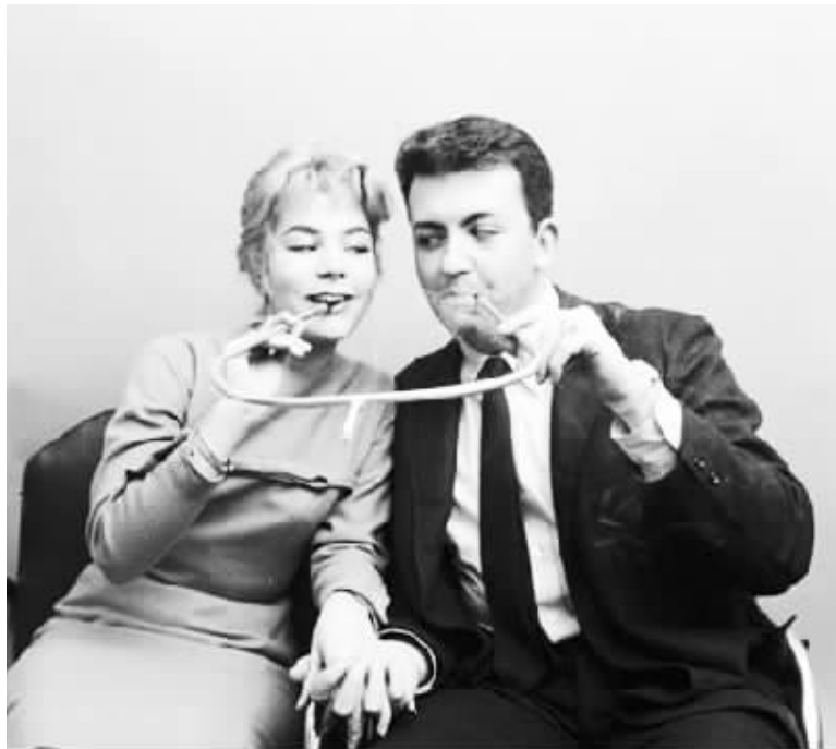
1955年发明的双人用吸管,现在也有人用,但总让人觉得有点不舒服。