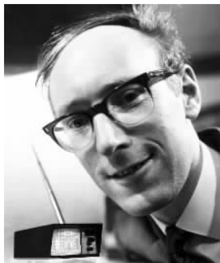
1966年发明的迷你电视,英国发明家克拉夫辛克莱发明了这种超小的电视机。