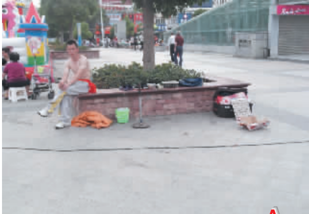
▶▶▶ 相关新闻见今日 A5 版