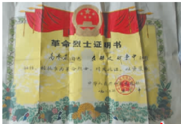
▶▶▶ 相关新闻见今日 A4 版