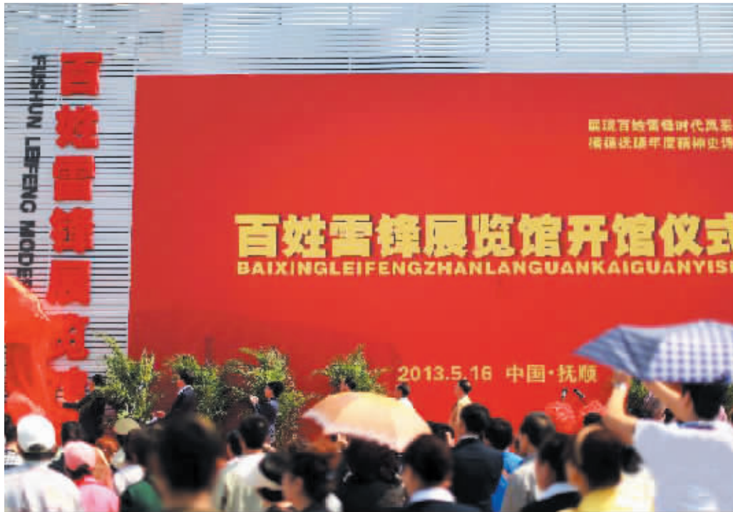
5月16日,百姓雷锋展览馆开馆仪式上举行揭牌仪式。当日,百姓雷锋展览馆在雷锋第二故乡——辽宁省抚顺市开馆。展览馆包涵“百姓雷锋”事迹展览、《百姓雷锋》杂志、“百姓雷锋”大讲堂和“百姓雷锋”联谊会等内容,展览馆向社会公众免费开放。