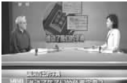
漏洞百出的字典,谁动了孩子们的免费字典。