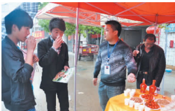
信阳消息(见习记者 刘方)近日,为期三天的信阳仙灵红红茶酒品鉴会在平桥区洋河镇举行。会上该产品代理商决定,将展销期间的所有利润全部捐献给雅安地震