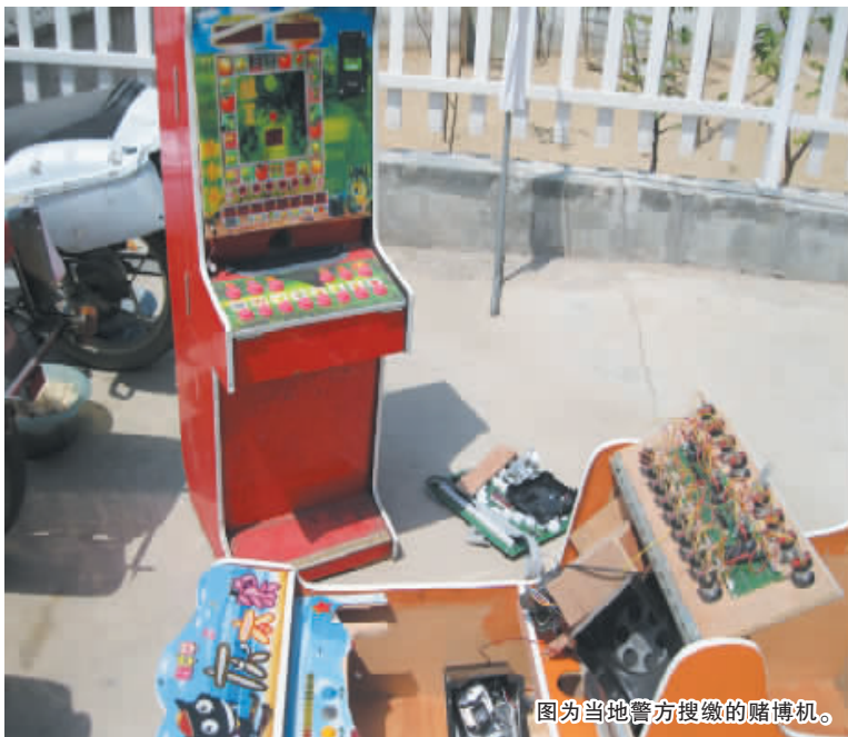
图为当地警方搜缴的赌博机。

通过“五一”小长假对校园周边环境进行整治和治理,民警采集各类可疑人员信息50余条,收缴、摧毁赌博游戏机2台,有效遏制了学生利用游戏机进行赌博势头,净化了校园环境。