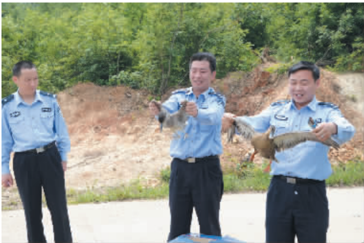
图为民警正在放生被捕的野生鸟类。