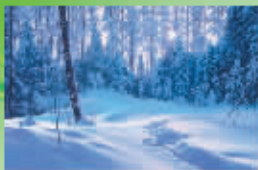
洛格洋伊 雪林晨光