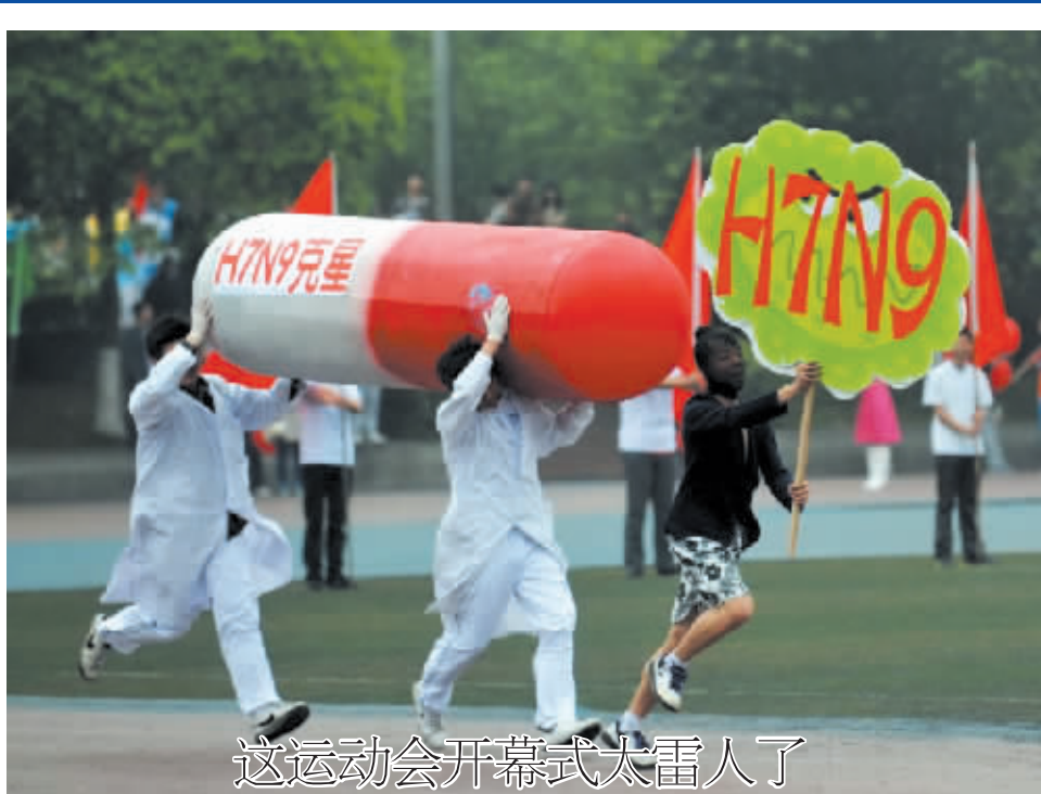
这运动会开幕式太雷人了