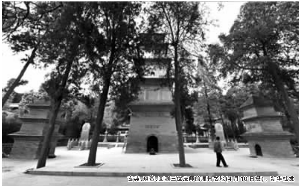
玄奘、窥基、圆测三位法师的埋骨之地(4月10日摄)。

兴教寺位于西安城南20公里处,长安区杜曲镇少陵原畔,长安区樊川北原。是唐代著名翻译家、旅行家玄奘法师长眠之地。公元664年,著名高僧玄奘法师圆寂后,葬于白鹿原,唐高宗二年(公元669年)又改葬为樊川风栖塬,并修建了五层灵塔,次年因塔建寺,唐肃宗题“兴教”二字从此取名兴教寺。现为全国重点文物保护单位。