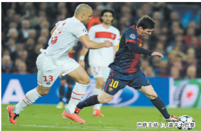
巴萨主场 1:1 逼平大巴黎