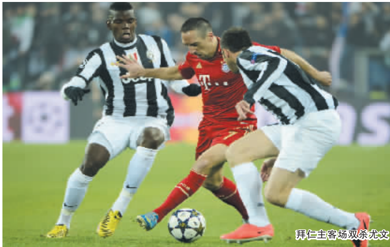
拜仁主场双杀尤文