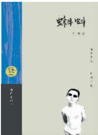
【书籍信息】 书名:《蝌蚪》 作者:弋舟