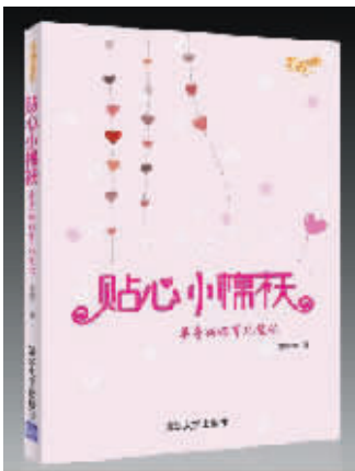
不同版本,相类故事

美国版《当幸福来敲门》所描述的是美国著名黑人投资专家克里斯·加德纳的自传,是一部从贫民窟到华尔街、底层黑人白手起家的商界传奇,也是一部历经磨难不离不弃、单亲父亲感人至深的励志经典。这部著作在美国由 Harper Collins 出版后曾荣登《纽约时报》畅销排行榜第一名。《纽约时报》评论说:“这部影片是现实世界的童话,史密斯和他儿子的表演压倒了一切。”