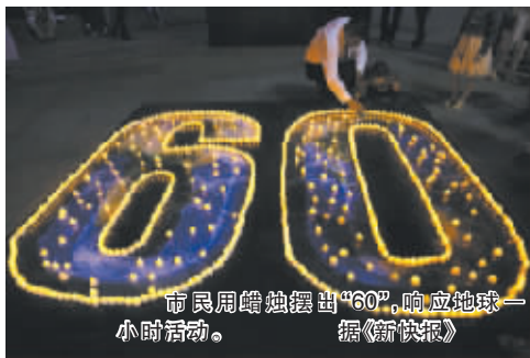
市民用蜡烛摆出“60”，响应地球一小时活动。