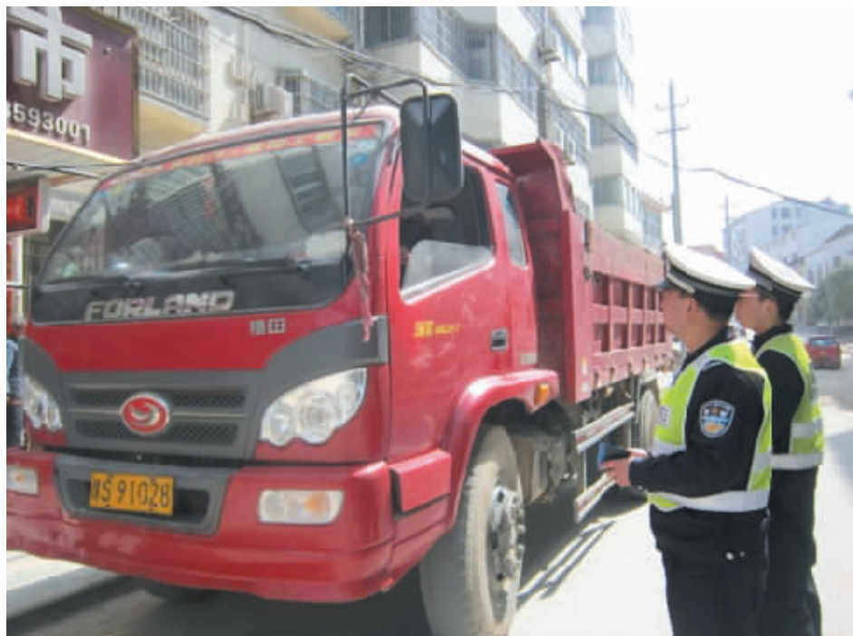
近日,为规范辖区“渣土车”管理,严厉打击“渣土车”交通违法行为,新县公安交警大队持续开展了工程“渣土车”违法行为集中整治专项行动。自1月份以来,该大队共出动警力320余人次,查处渣土车各类违法行为540余起,查扣渣土车37辆,开展“渣土车”从业人员集中教育专题宣传6场(次)。图为该大队交警对“渣土车”号牌、车主、驾驶人等基本信息进行登记。

法院经审理认为,本案是多种行为过错导致的一种危害后果,各被告均应承担相应的责任。审理中三自然人被告均承认在河中下网,且没有人员看护,也没有设置任何警示标志,但都不承认致死被害人的渔网系自己所有,也不能指认明确的加害人。法院据此认定三自然人被告分别采取了危及被害人生命的危险行为,依法应当承担赔偿责任。被告石湾水库管理局在停止供水后在原告居住附近干渠保持一段高水位人工河,且未尽到管理职责,对三被告在河中下网可能危及他人人身安全的行为持放任态度,在行为上有过错,应承担相应责任。本案被害人年仅12周岁,在没有大人看护的情况下在危险场地玩耍,并采取了高度危险行为,最终危及本人生命,对危害结果的发生负有责任,可以依法减轻三被告的民事责任。其中被害人张正负60%的责任,三被告各负10%的责任。法院遂依法作出上述判决。(文中人名均系化名)