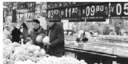
居民消费价格涨幅 3.5% 左右

今年经济社会发展的主要预期目标是:国内生产总值增长 7.5% 左右,发展的协调性进一步增强;居民消费价格涨幅 3.5% 左右;城镇新增就业 900 万人以上,城镇登记失业率低于 4.6%;城乡居民人均收入实际增长与经济增长同步,劳动报酬增长和劳动生产率提高同步;国际收支状况进一步改善。