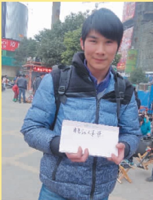
人物二:小吕 家乡:驻马店 目的地:天津

电话里曹先生的母亲不停地叮嘱他们夫妻俩,火车上一定要看好孩子,给孩子多喝水,不要吃太多零食。曹先生和妻子都在许昌的建筑工地上打工,已经在那边安家了,孩子也在许昌上了小学,一家三口每年只有春节才能回老家看望老人。新的一年,曹先生给自己定下了目标,买车买房,希望能给妻子和孩子更好的生活环境,能经常回家探望父母。