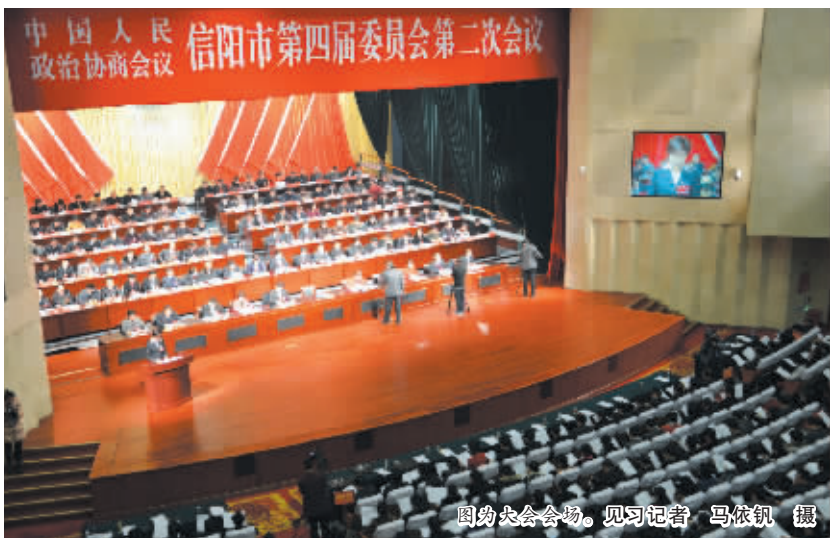
图为大会会场。

信阳消息(记者 黄慧)春节的鞭炮声才刚刚响毕,2月18日上午9时,中国人民政治协商会议信阳市第四届委员会第二次会议在百花之声大剧院隆重开幕。