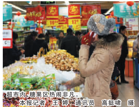
超市内,糖果区热闹非凡。

市工商局: 12315 市物价局: 12358 市质量技术监督局: 12365 市城市管理综合执法局: 6381234 6382345