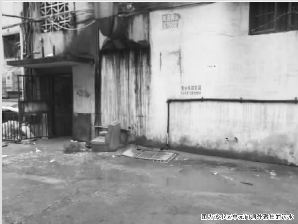
图为该小区单元门外聚集的污水

信阳消息(见习记者 周亚涛 实习生 李显文)近日家住四一路华银酒店对面居民楼的居民反映,居民楼下的窨井处污水横流,垃圾、剩饭到处都是,希望本报记者能帮他们找有关部门反映情况,好让他们过一个干净的新年。