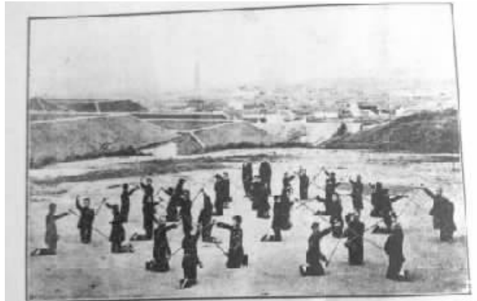
影摄操體通普班三級一校學範師一第立省南湘