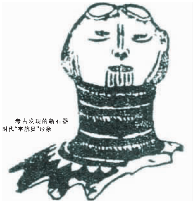
考古发现的新石器时代“宇航员”形象