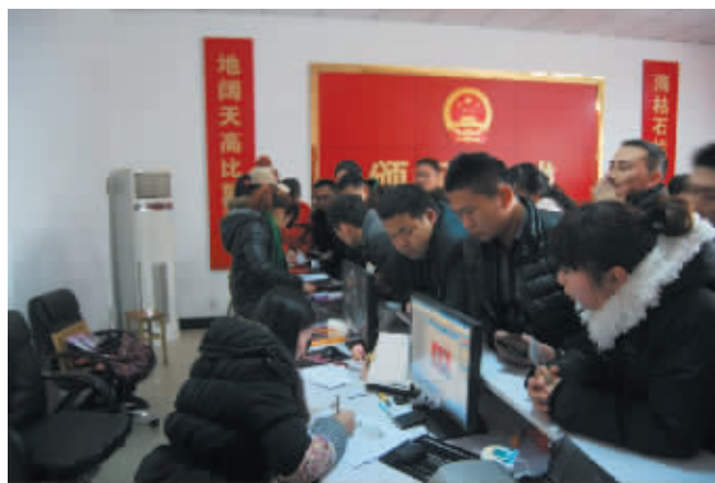
排队登记结婚的新人。