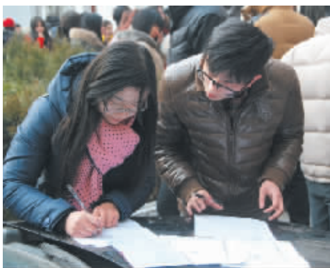
一对年轻人避开人群,在停靠在民政局院内的汽车上填写结婚登记表。