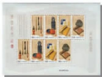
中国第一张用丝绸印刷的邮票 ——《文房四宝》