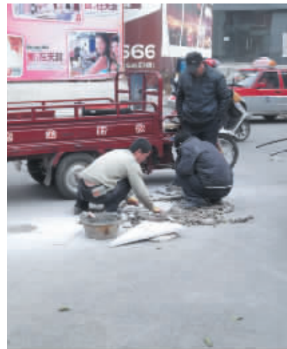
近日,为了使胜利路步行街街道的整洁美观,给市民营造良好的休闲购物环境,胜利路步行街管理办公室组织工作人员对街道上破损的石板进行更换。图为施工现场。

记者了解到,手工定制也提供贴心上门服务。市民杨女士就住在该条胡同附近,前几天刚找陈师傅给两岁的小孙女定做了一套棉衣,这次来是想给老母亲也定做一套,由于老人年纪大行动不方便,请陈师傅去她家给老人量尺寸。杨女士说:“新棉花手工缝制的棉衣暖和透气,价格适中,跟商场里卖的棉衣相比实惠多了。”