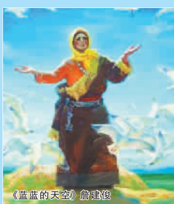
《蓝蓝的天空》詹建俊