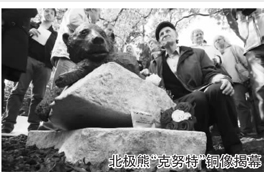
北极熊“克努特”铜像揭幕

双方在会议上商定，将通过延伸威慑政策委员会制定“有针对性的双边威慑战略”，双方在当天的会议上批准了与这一战略相关的概念与原则。 (据新华社)