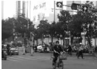
乱象四:“争分夺秒”。眼看还有1秒钟直行绿灯才亮起,可是图上的这位市民已经急不可耐、先行一步了。