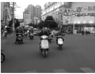
乱象二:无视斑马线。斑马线本是行人和非机动车辆过马路时的专属区域,但是本该在斑马线上通行的却蜂拥到机动车道上,本该在斑马线一端等待的却占据了斑马线。