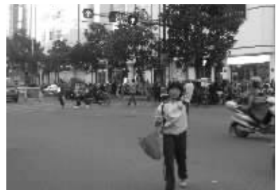
乱象三:斜穿马路成习惯。很多市民嫌直行两次太麻烦,需要通过两个红绿灯,干脆就45度角斜行穿过,一次搞定。