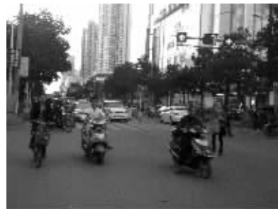
乱象一:无视红绿灯。该不该过马路,红绿灯说得不算,全凭自己做主。稍作观察,暂无车辆就迈开步伐急穿过去。于是你过我也过,人多好壮胆,集体闯红灯。

“中国式过马路”,是网友对部分中国人集体闯红灯现象的一种调侃,即“凑够一撮人就可以走了,和红绿灯无关。”近几日,这个词红遍了网络。纵观信阳,“中国式过马路”也演绎出了多种本地版本。据浉河勤务一大队的一名交警介绍:这些无视交通规则的行为不仅存在很大的安全隐患,而且已经成为很多路口交通拥堵的主要原因。良好有序的交通环境需要交管部门的有效管理,但是更需要每位出行市民从自身做起,规范遵守交通规则。因此本报再次呼吁广大市民:为了您的安全,请遵守交通规则!